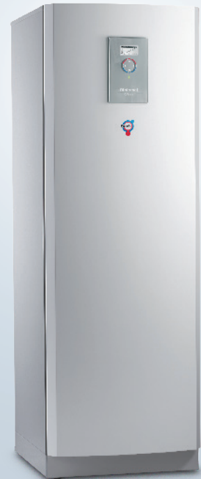
Diplomat Duo Optimum